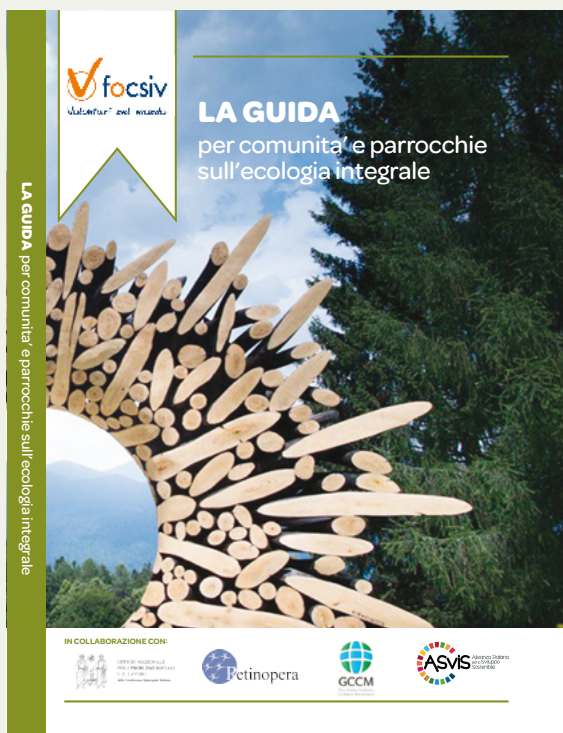
La Guida per comunità e parrocchie sull'Ecologia Integrale 2020 – FOCSIV

Per partecipare è richiesta l'iscrizione e il versamento di una quota di partecipazione di 30€ come impegno di presenza e relativo minimo sostegno ai costi del corso. Ai partecipanti oltre alle lezioni e alla interazione con i relatori verranno forniti materiali come registrazioni, slide e documenti e, su richiesta, un attestato di partecipazione. Per ogni modulo di formazione i Media Partner indicheranno ai partecipanti alcuni testi come suggerimento per l'approfondimento e Avvenire fornirà l'accesso gratuito al quotidiano on line.